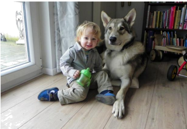
można na nim polegać w znacznym stopniu