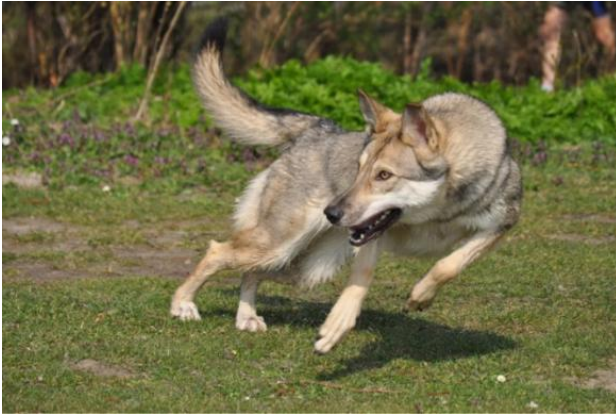
energiczny pies, tryskający energią

ZACHOWANIE /TEMPERAMENT: Jest to pies o żywym usposobieniu, pełen energii, z dumnym i niezależnym charakterem. Znany przede wszystkim z posłuszeństwa z własnej woli. W stosunku do swojego pana jest oddany i można na nim polegać w znacznym stopniu. Wobec obcych może być powściągliwy i zwykle nie szukać kontaktu. Typowy dla Saarlooswolfhond jest powściągliwy i wilczy sposób unikania nieznanymi sytuacji.