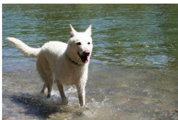
biały oraz biały krem