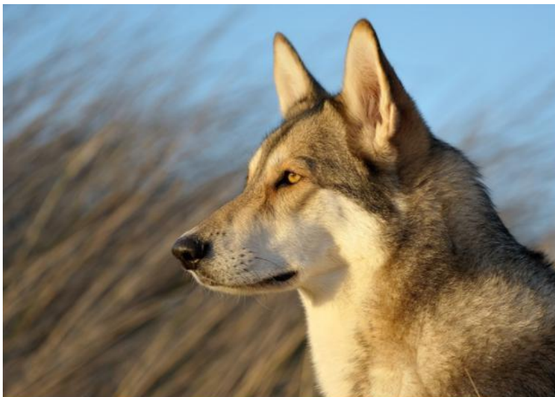
požadany wilczy wygląd

USZY: Średniej wielkości, mocno stojące uszy, trójkątne i zaokrąglone. Wewnątrz owłosione. Uszy osadzone na wysokości oczu. Uszy są bardzo ruchliwe i wyrażają emocje i uczucia psa.