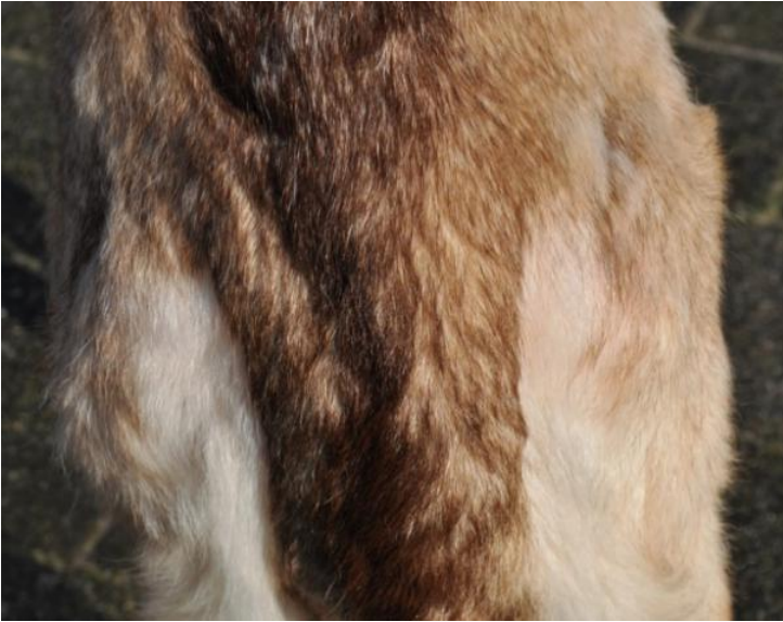
szeroki ogon, obficie owłosiony