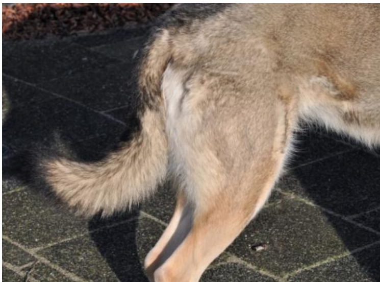
lub lekko zakrzywiony w kształcie szabli