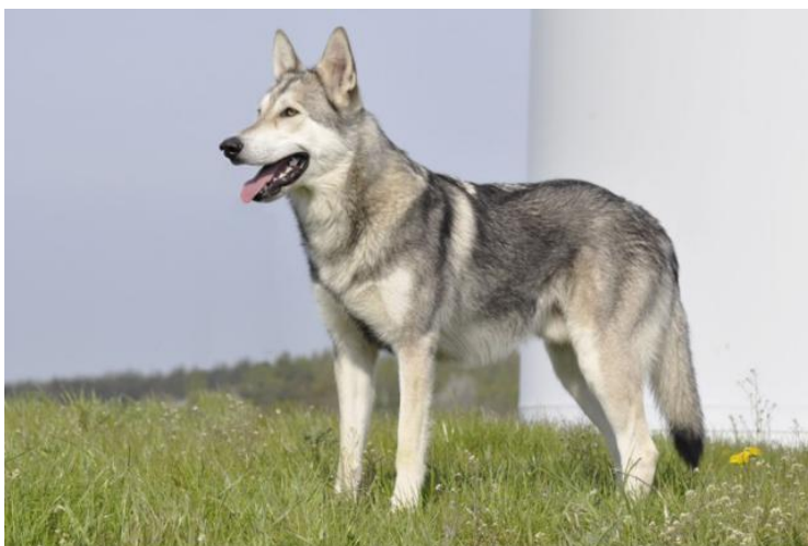
normalne kątownie między łopatką a ramieniem