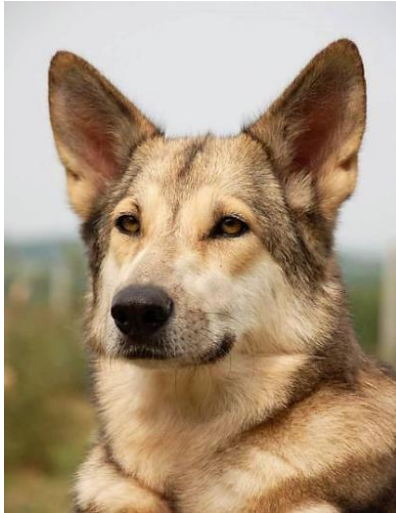
uszy są osadzone na wysokości oczu

SZYJA : Sucha i dobrze umięśniona, płynnie przechodząca w linię grzbietu. Tak samo jak płynna jest linia od gardła do klatki piersiowej. Szyja, zwłaszcza przy płaszczu zimowym, jest ozdobiona pięknym kołnierzem (kryzą). Skóra gardła nie powinna być obfita i rzucać się w oczy. Typowe dla Saarlooswolfhond jest to, że w rozluźnionym klusie głowa i szyja tworzą prawie poziomą linię.