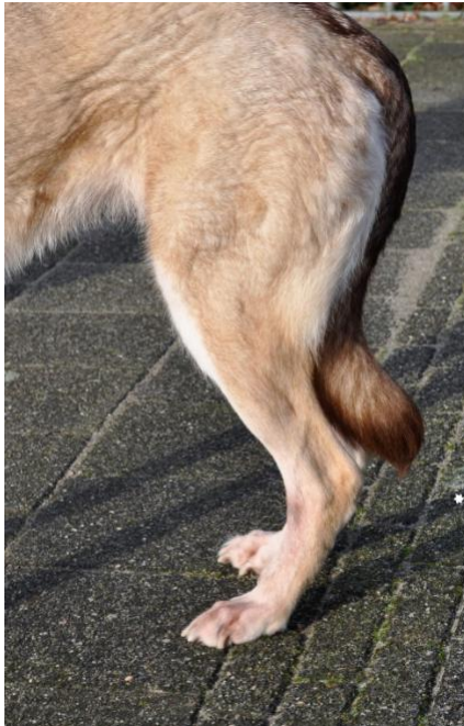
normalne udo, dobrze umięśnione