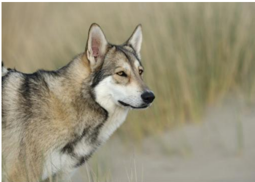
bardzo płynna linia

SZYJA : Sucha i dobrze umięśniona, płynnie przechodząca w linię grzbietu. Tak samo jak płynna jest linia od gardła do klatki piersiowej. Szyja, zwłaszcza przy płaszczu zimowym, jest ozdobiona pięknym kołnierzem (kryzą). Skóra gardła nie powinna być obfita i rzucać się w oczy. Typowe dla Saarlooswolfhond jest to, że w rozluźnionym klusie głowa i szyja tworzą prawie poziomą linię.