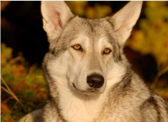
kolor żółty, w kształcie migdałów

OCZY: Żółtego koloru, w kształcie migdałów. Osadzone lekko skośnie, nie wypukłe i nie okrągłe, z dobrze przylegającymi powiekami. Wyrażenie jest czujne, powściągliwe, ale nie niespokojne. Oko jest bardzo ważną cechą rasy, która podkreśla pożądaną wilczy wygląd. Pożądaną ekspresję osiąga tylko jasne oko. Dużą wagę należy przywiązywać do koloru, kształtu i prawidłowego osadzenia w czaszce. U starszych psów żółty kolor oczu może ciemnieć, ale powinna zachować pierwotne odniesienie do żółtego koloru. Brązowy kolor oczu jest niepożądany. Oczodół łączy się z czaszką płynną linią; zbyt wyraźny oczodół z wyraźnym łukiem brwiowym i zaznaczonym stopem jest niepożądany.