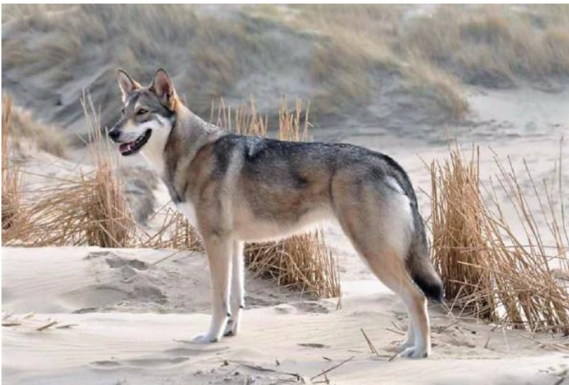
ogon prawie prosty