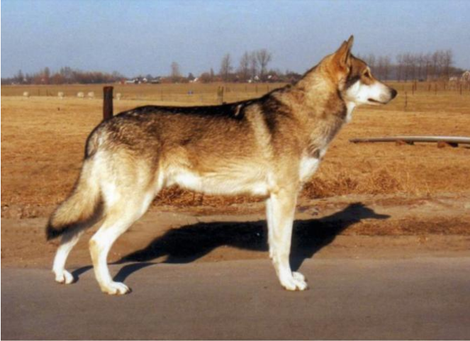
miednica często wydaje się być ułożona bardziej skośnie